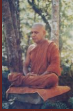
පූජ්‍ය කුඩාවැල්ලේ වංගීස හිමි