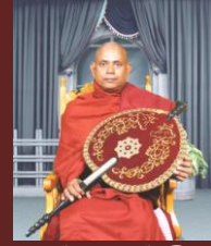
පූජ්‍ය තපෝවනයේ නිවාන හිමි